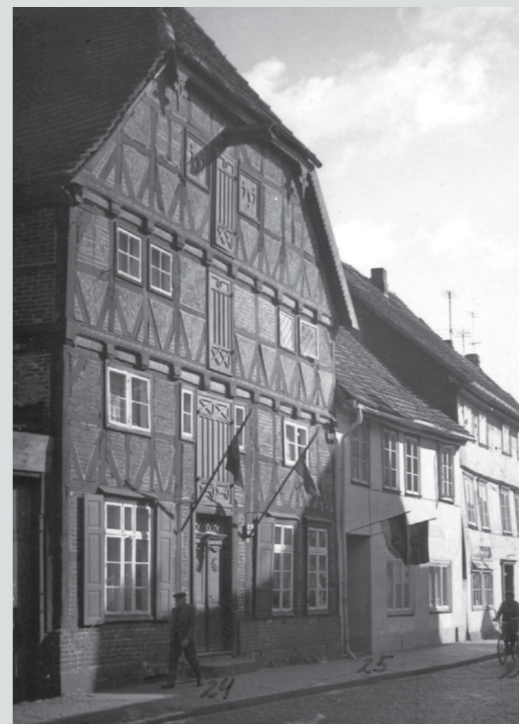
Ansicht von 1968