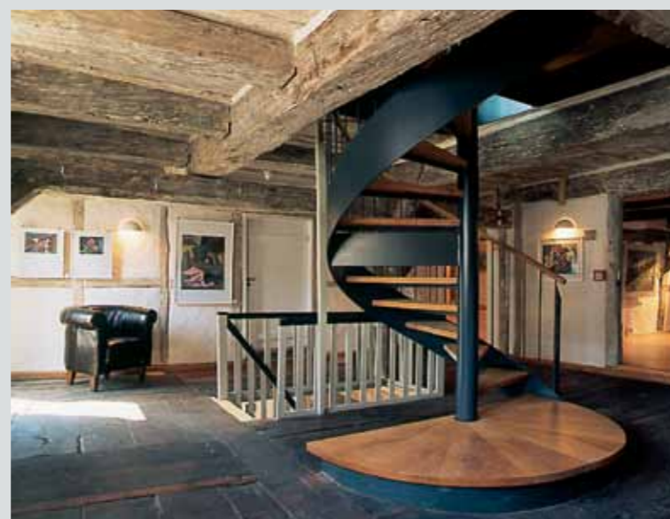
Neue Wendeltreppe zum Dachgeschoss und