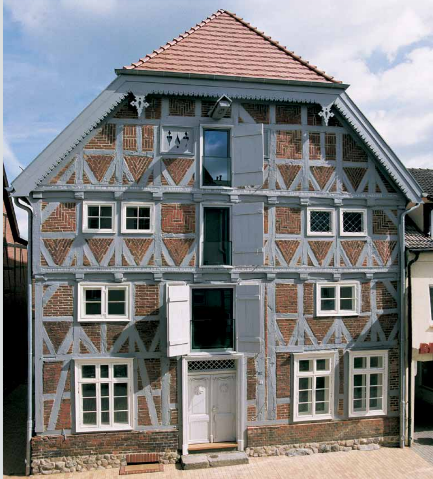
„Zinnhaus“-Straßengiebel nach der Sanierung 2001